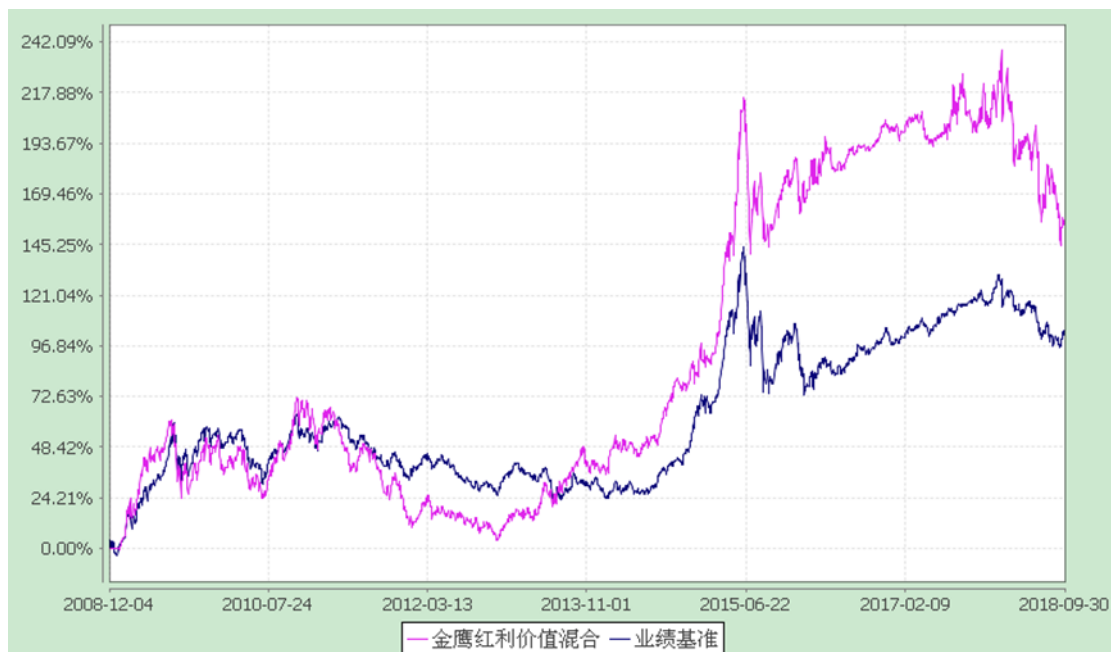
金鹰红利价值灵活配置混合型证券投资基金 累计净值增长率与业绩比较基准收益率历史走势对比图 (2008 年 12 月 4 日至 2018 年 9 月 30 日)