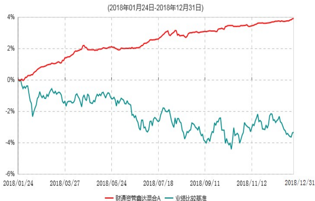
财通资管鑫达混合A累计净值增长率与业绩比较基准收益率历史走势对比图