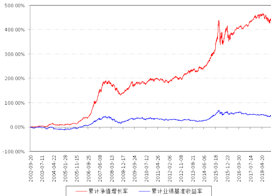
南方宝元A累计净值增长率与同期业绩比较基准收益率的历史走势对比图