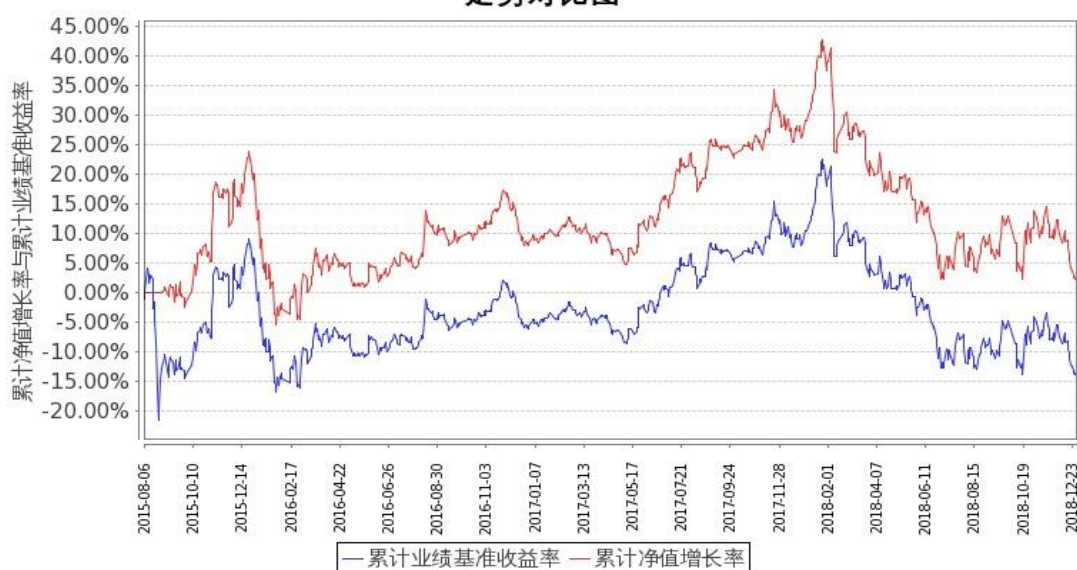
图1：嘉实中证金融地产ETF联接A基金份额累计净值增长率与同期业绩比较基准收益率的历史走势对比图 (2015年8月6日至2018年12月31日)