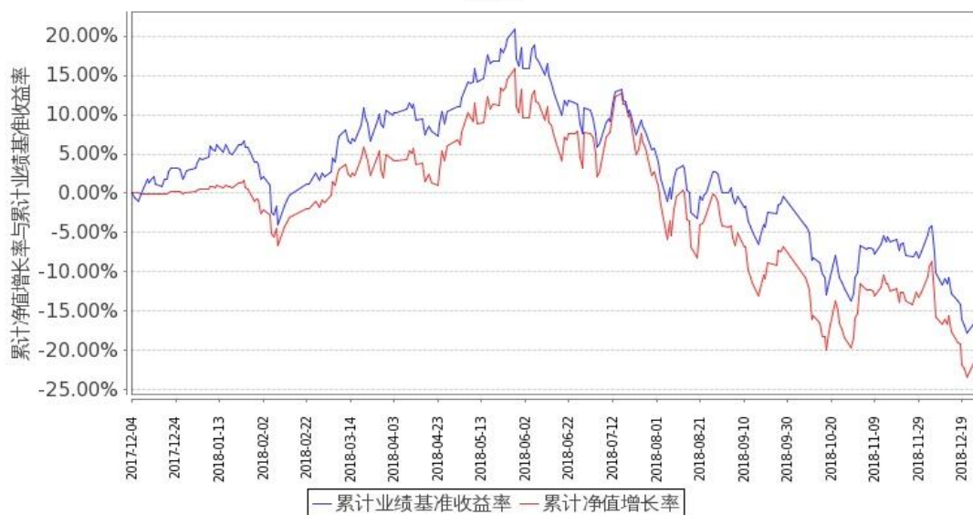
图 1：嘉实医药健康股票 A 基金累计份额净值增长率与同期业绩比较基准收益率的历史走势对比图