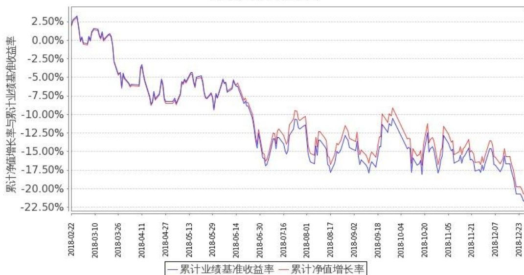
图 2：嘉实富时中国 A50ETF 联接基金 C 类基金份额累计净值增长率与同期业绩比较基准收益率的历史走势对比图