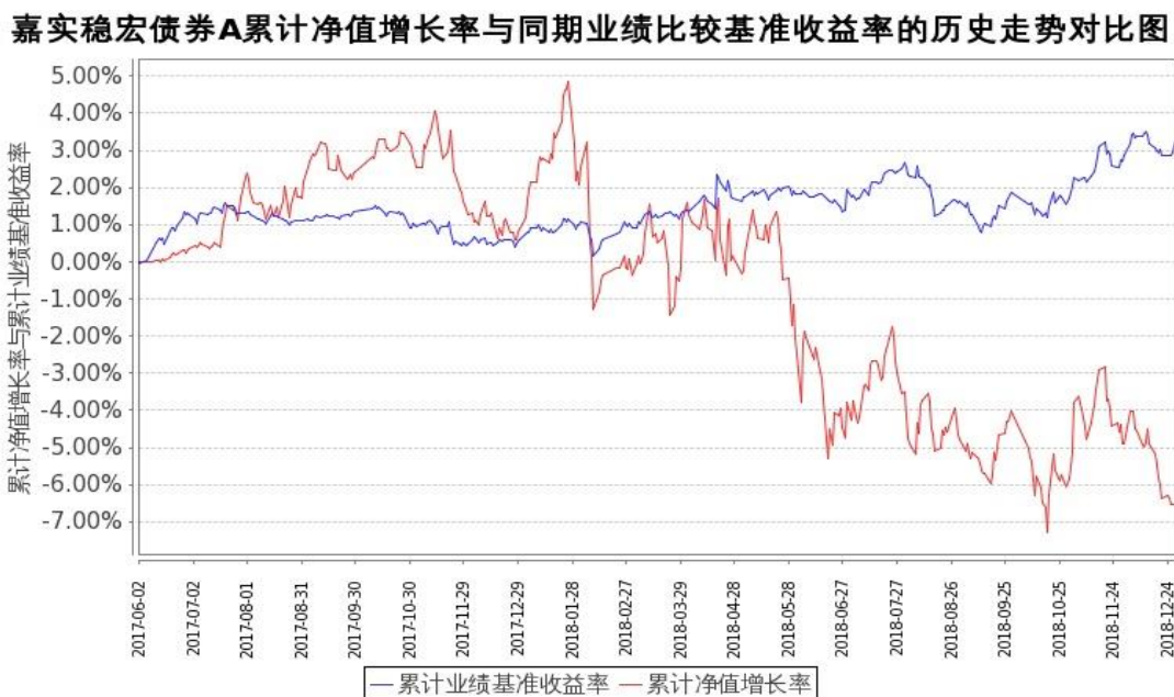
图 1：嘉实稳宏债券 A 基金份额累计净值增长率与同期业绩比较基准收益率的历史走势对比图