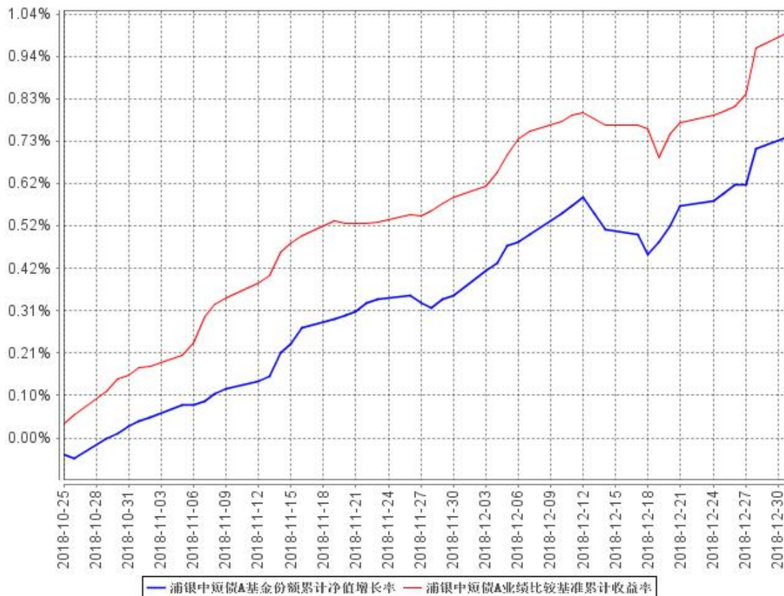
浦银中短债A基金份额累计净值增长率与同期业绩比较基准收益率的历史走势对比图