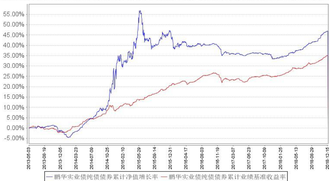
鹏华实业债纯债债券累计净值增长率与同期业绩比较基准收益率的历史走势对比图

注：1、本基金基金合同于 2018 年 12 月 19 日生效，截至本报告期末本基金基金合同生效未满一年。2、本基金管理人将严格按照本基金合同的约定，于本基金建仓期届满后确保各项投资比例符合基金合同的约定。