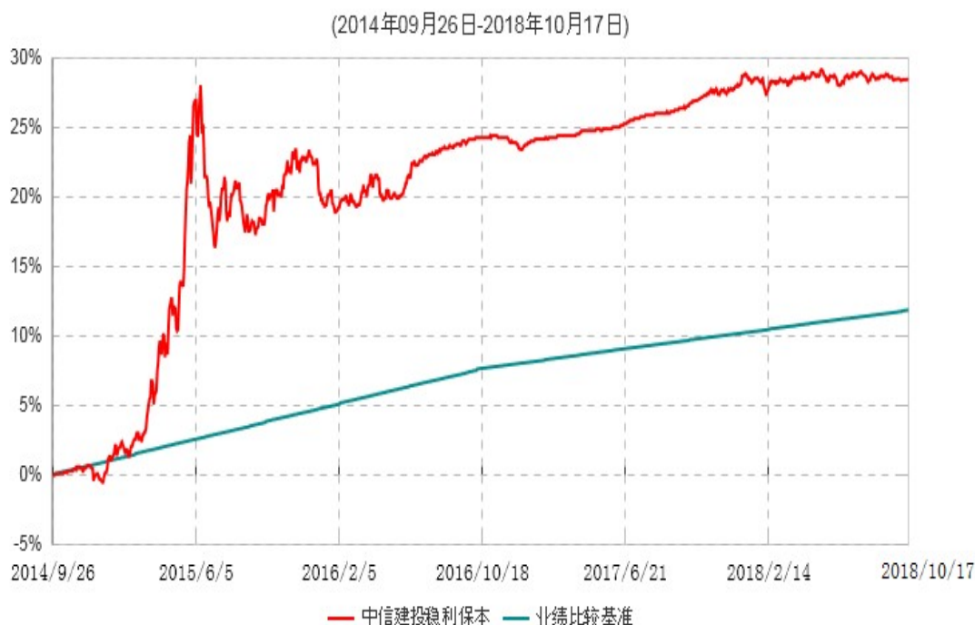
中信建投稳利保本混合型证券投资基金累计净值增长率与业绩比较基准收益率历史走势对比图

注：根据《中信建投稳利保本混合型证券投资基金基金合同》的有关规定，2018年10月12日为本基金的第二个保本周期到期日。