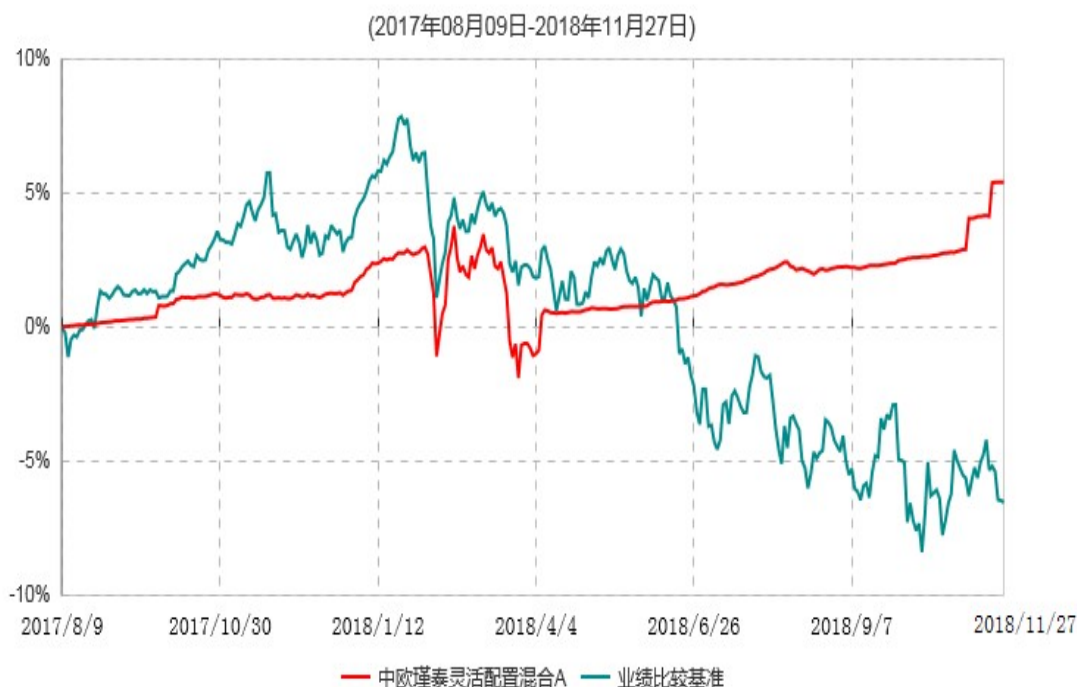
中欧瑾泰灵活配置混合A累计净值增长率与业绩比较基准收益率历史走势对比图