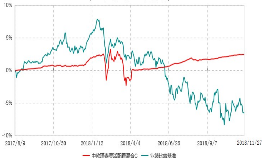
中欧瑾泰灵活配置混合C累计净值增长率与业绩比较基准收益率历史走势对比图 (2017年08月09日-2018年11月27日)

注：本基金基金合同生效日期为 2017 年 8 月 9 日，按基金合同的规定，本基金自基金合同生效起六个月为建仓期，建仓期结束时各项资产配置比例已达到基金合同约定。