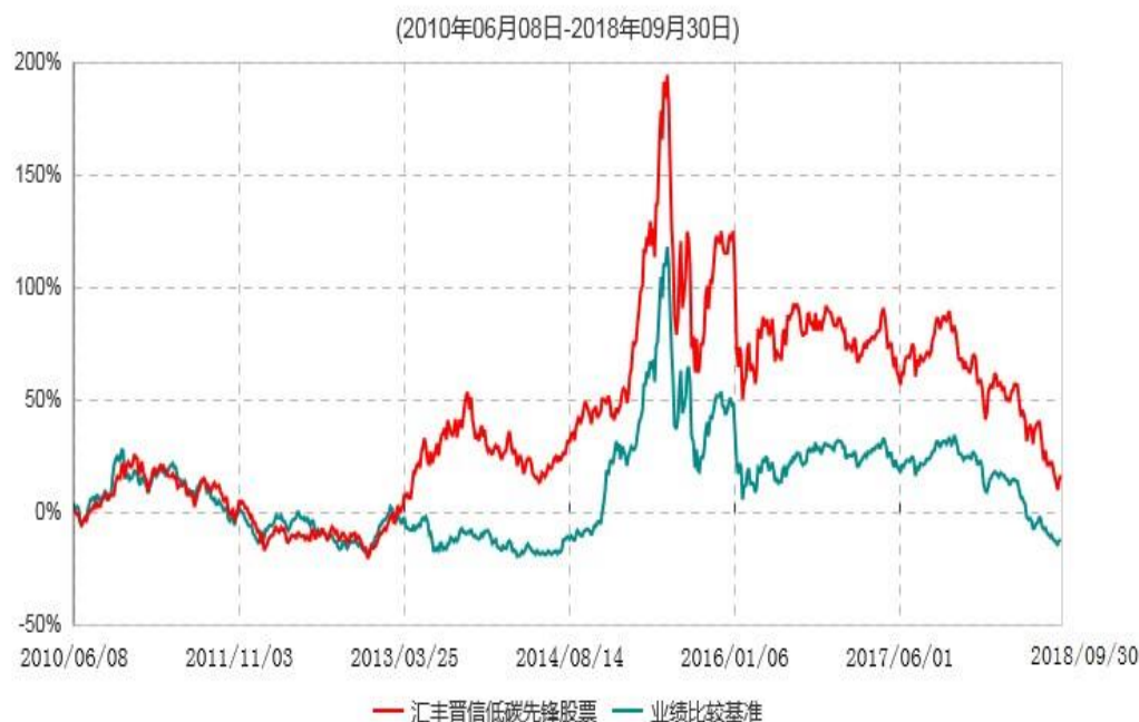
汇丰晋信低碳先锋股票型证券投资基金累计净值增长率与业绩比较基准收益率历史走势对比图