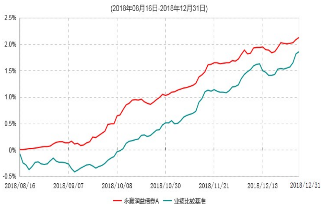
永赢润益债券A累计净值增长率与业绩比较基准收益率历史走势对比图

注：1、本基金合同生效日为 2018 年 8 月 16 日，截至本报告期末本基金合同生效未满 1 年； 2、本基金建仓期为本基金合同生效日起 6 个月，截至本报告期末，本基金尚处于建仓期中。