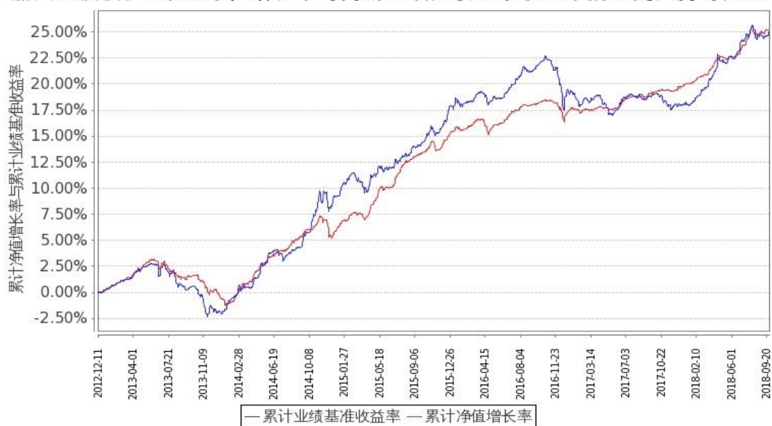
图2：嘉实纯债债券C基金份额累计净值增长率与同期业绩比较基准收益率的历史走势对比