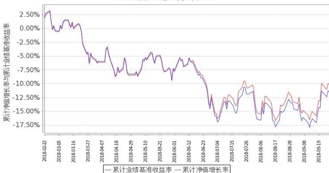
图 2：嘉实富时中国 A50ETF 联接基金 C 类基金份额累计净值增长率与同期业绩比较基准收益率的历史走势对比图 (2018 年 2 月 22 日至 2018 年 9 月 30 日)

注：按基金合同和招募说明书的约定，本基金自基金合同生效日起 6 个月内为建仓期，建仓期结束时本基金的各项投资比例符合基金合同（十二（二）投资范围和（四）投资限制）的