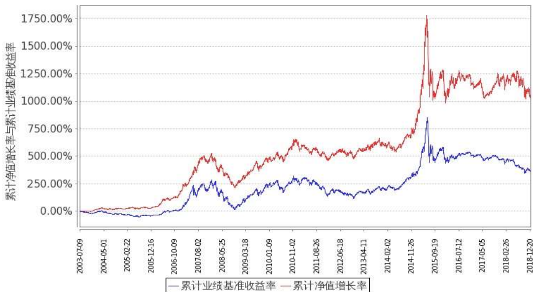
图：嘉实增长混合份额累计净值增长率与同期业绩比较基准收益率的历史走势对比图