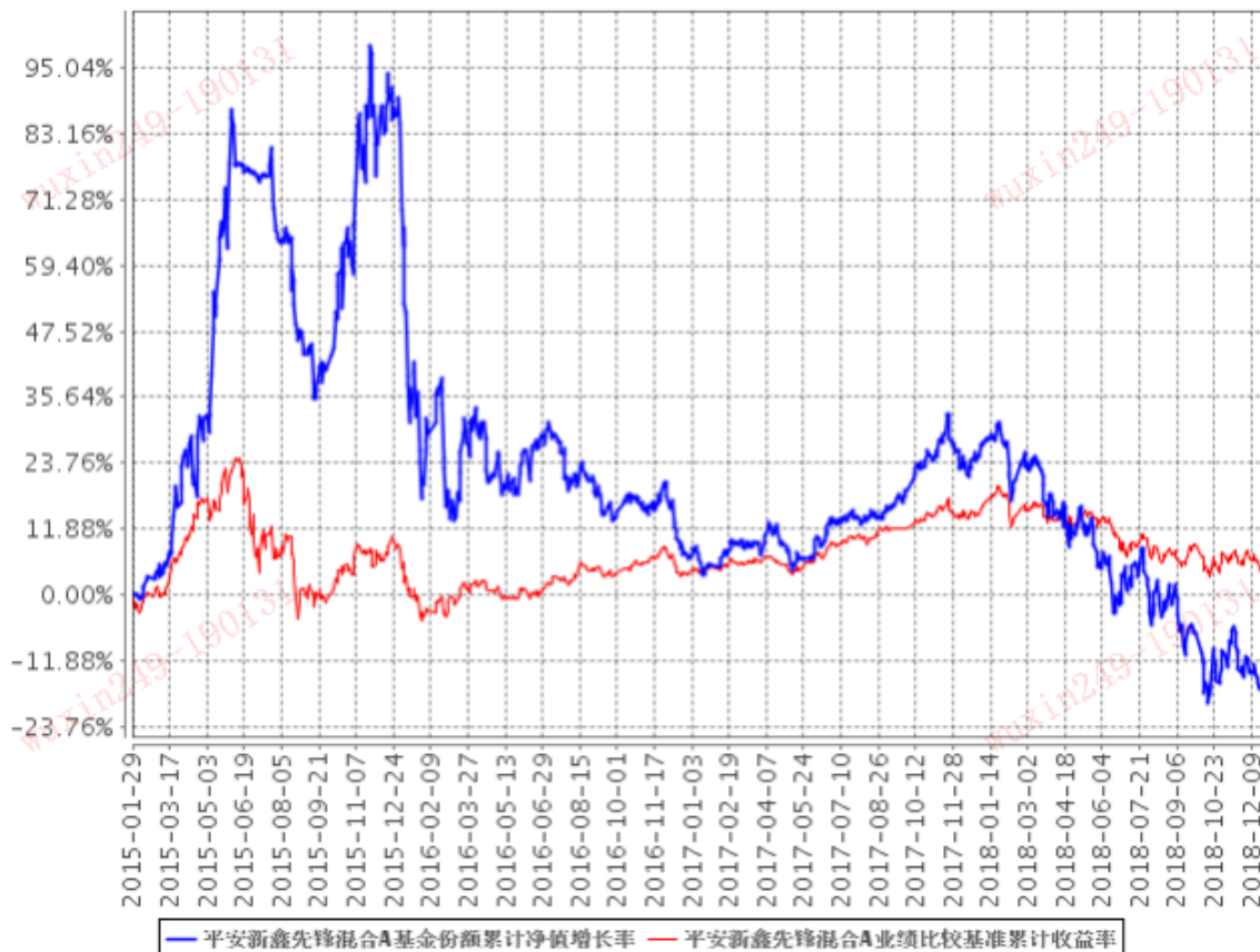
平安新鑫先锋混合A基金份额累计净值增长率与同期业绩比较基准收益率的历史走势对比图