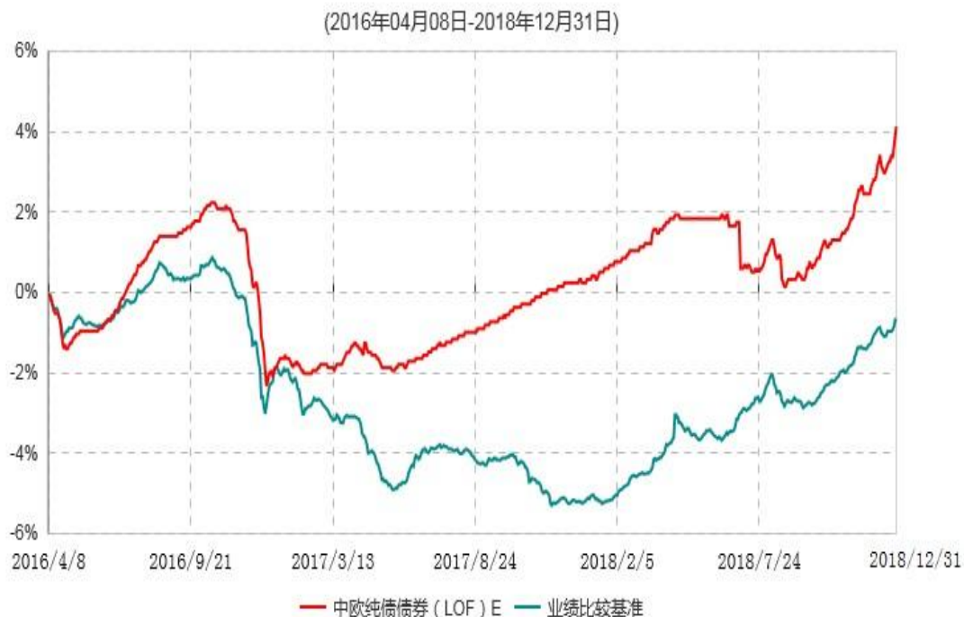
中欧纯债债券（LOF）E累计净值增长率与业绩比较基准收益率历史走势对比图

注：自2016年4月6日起，本基金新增E类份额，图示日期为2016年4月8日至2018年12月31日。