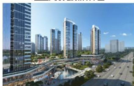
珠海横琴科学城一期效果图