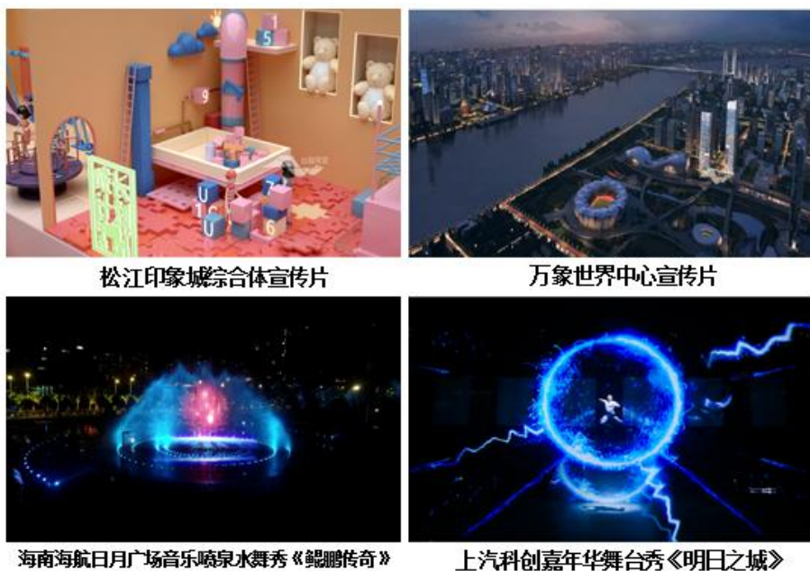
松江印象城综合体宣传片

公司CG动态视觉服务是利用CG技术，将创意方构想展现为数字化的视频或多媒体作品，实现动态视觉效果并提供相配套的辅助功能；主要产品形式为动画影片、宣传片、特效和各类CG多媒体内容。目前，公司该类业务主要客户为房地产行业客户、各类商业客户和政府类机构，通过运用动画影片等形式，帮助各行业客户更好地展示其产品、服务，实现展示及营销目的。CG动态视觉服务相关产品与服务图示如下：