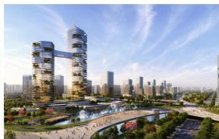
长沙高铁西城片区城市设计效果图