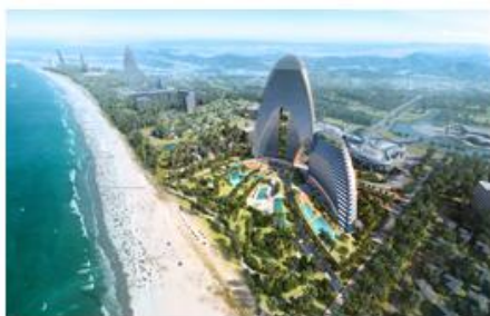
三亚国际免税城效果图

公司CG静态视觉服务是利用CG技术，通过计算机软件模拟，将设计人员的创意和构思展现为数码化的三维静态图像。该服务主要产品形式为各类视觉效果图像，主要客户为建筑设计、规划设计、工业设计等行业。作为产业链中专业化分工的一个重要环节，公司通过专业技术和专注服务，帮助各行业呈现理想的虚拟效果。CG静态视觉服务相关产品与服务图示如下：