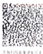
扫描二维码验证信息