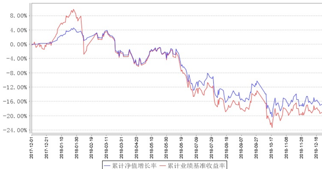
华泰紫金红利低波指数发起累计净值增长率与同期业绩比较基准收益率的历史走势对比图

注:本基金合同于 2017 年 12 月 1 日生效,截止本报告期末基金成立已满一年;自基金成立日起 6 个月内为建仓期,建仓期结束时各项资产配置比例符合合同预定。