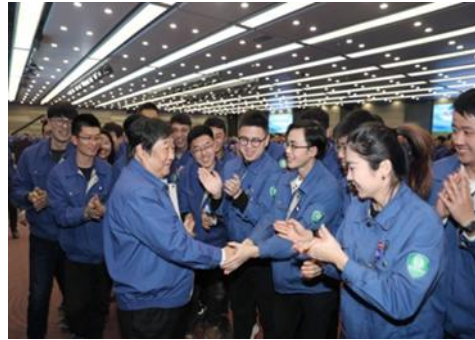
“激情成就梦想”青年员工交流会