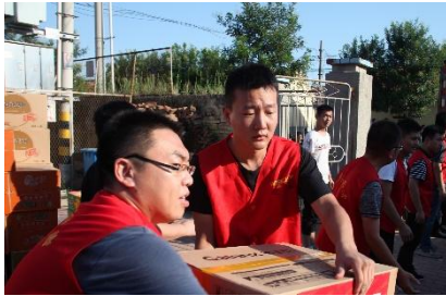
“情系灾区，奉献爱心”捐款活动

2018年8月，潍坊11个县市区遭受严重洪灾，公司组织“情系灾区，奉献爱心”捐款活动，得到广大员工的积极响应，不到一天时间筹集救灾款100多万元，公司第一时间将100多万元救灾款送到受灾群众手中，帮助受灾群众一起进行灾后重建工作。