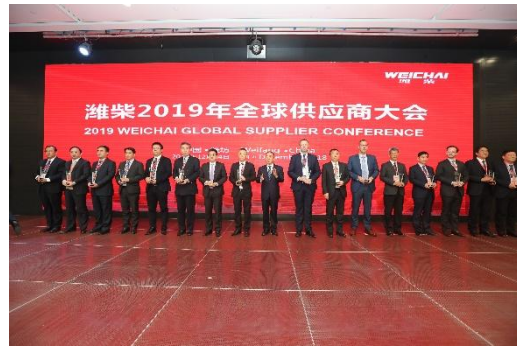
潍柴 2019 年度商务大会现场