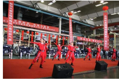
“携手新时代 共筑中国梦”慰问演出