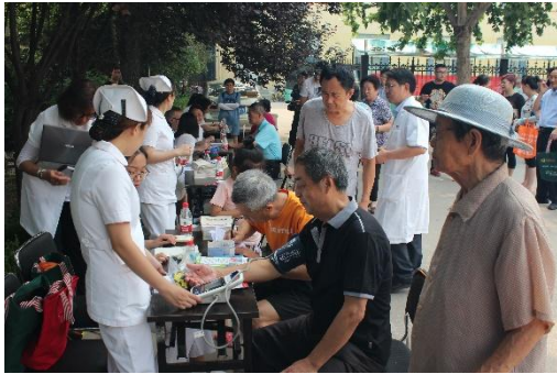
尊老爱老，服务老职工

全年走访慰问老职工356人次；为79名离休干部和老工人，办理就医医院签约、医疗证年审、药费凭证收取、审核报销；为117名遗属发放生活困难补助金；为退休职工办理慢性病证、医疗报销。组织球类、瑜伽、诵读、书画展、摄影展、文艺演出等文化体育活动38场。让广大退休职工充分感受到了企业的关怀和幸福感、参与感和获得感。