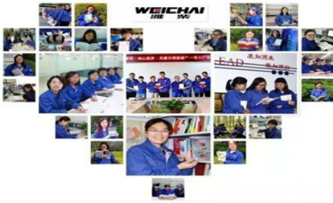
“引领女性阅读·建设文明家庭”读书活动