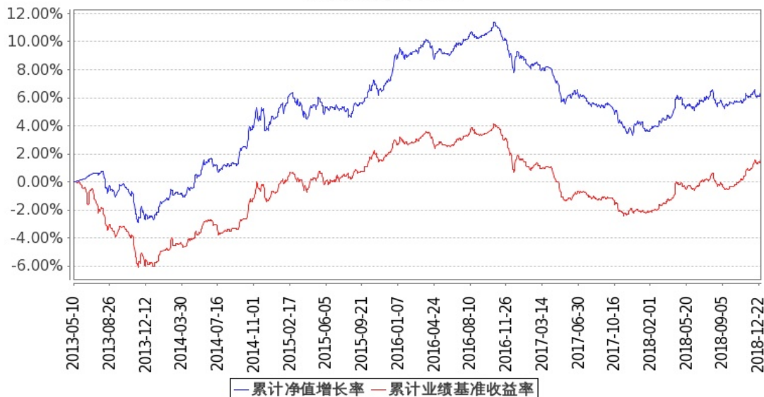
图 2：嘉实中证金边中期国债ETF联接C基金份额累计净值增长率与同期业绩比较基准收益率的历史走势对比图