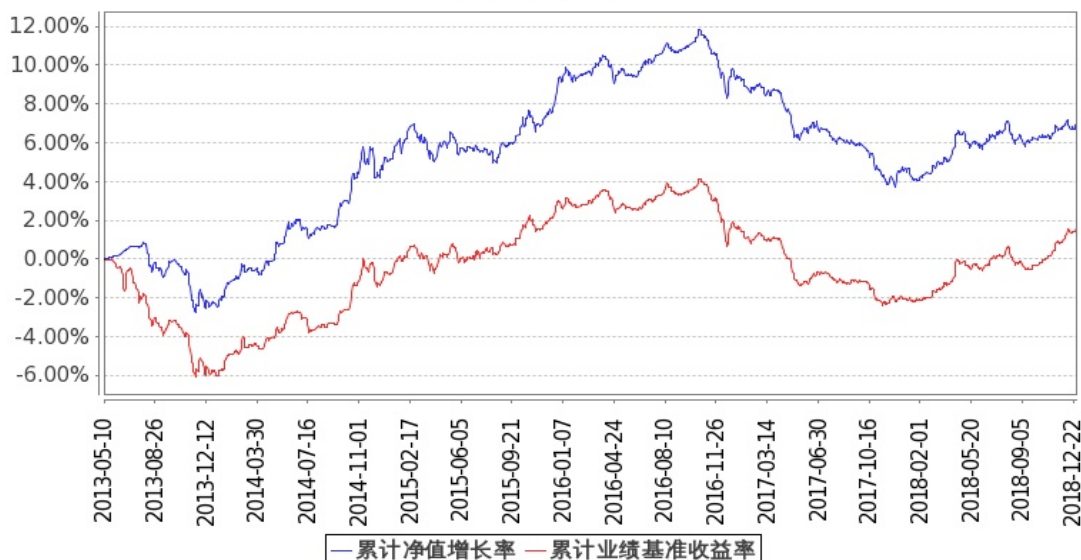
图 1：嘉实中证金边中期国债ETF联接A基金份额累计净值增长率与同期业绩比较基准收益率的历史走势对比图