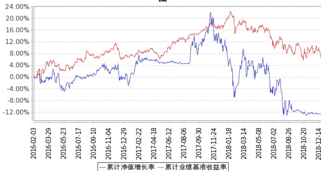
图：嘉实创新成长混合基金累计份额净值增长率与同期业绩比较基准收益率的历史走势对比图 (2016年2月3日至2018年12月31日)

注:1: 按基金合同和招募说明书的约定, 本基金自基金合同生效日起6个月内为建仓期, 建仓期结束时本基金的各项投资比例符合基金合同(十二(二)投资范围和(四)投资限制)的有关约定。