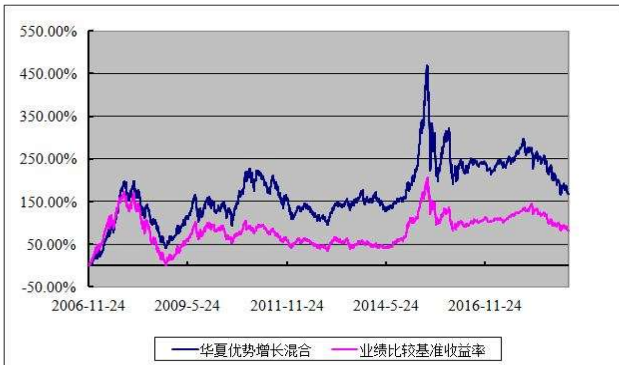
基金份额累计净值增长率与业绩比较基准收益率的历史走势对比图 (2006 年 11 月 24 日至 2018 年 12 月 31 日)