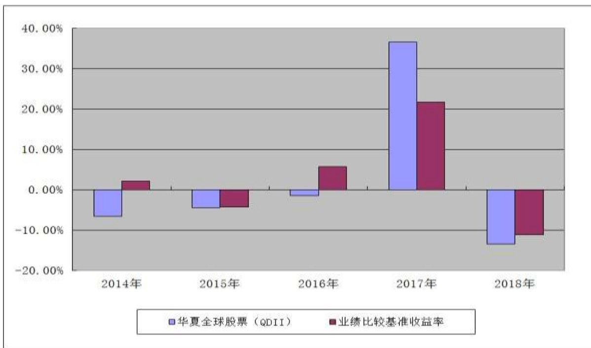
华夏全球精选股票型证券投资基金 基金每年净值增长率及其与同期业绩比较基准收益率的对比图