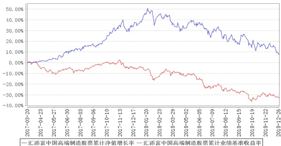
汇添富中国高端制造股票累计净值增长率与同期业绩比较基准收益率的历史走势对比图

注:本基金建仓期为本《基金合同》生效之日(2017年3月20日)起6个月,建仓期结束时各项资产配置比例符合合同规定。