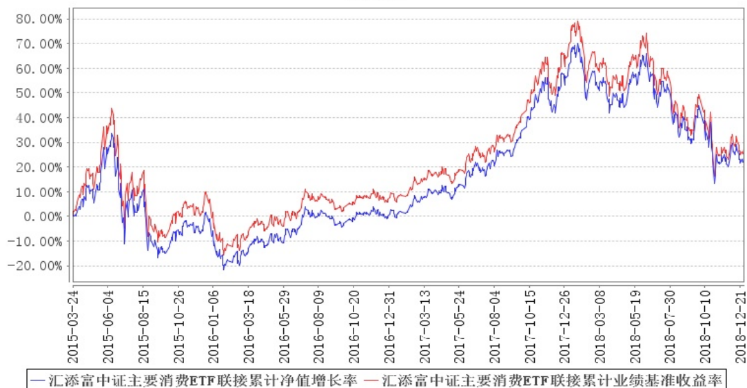
汇添富中证主要消费ETF联接累计净值增长率与同期业绩比较基准收益率的历史走势对比图