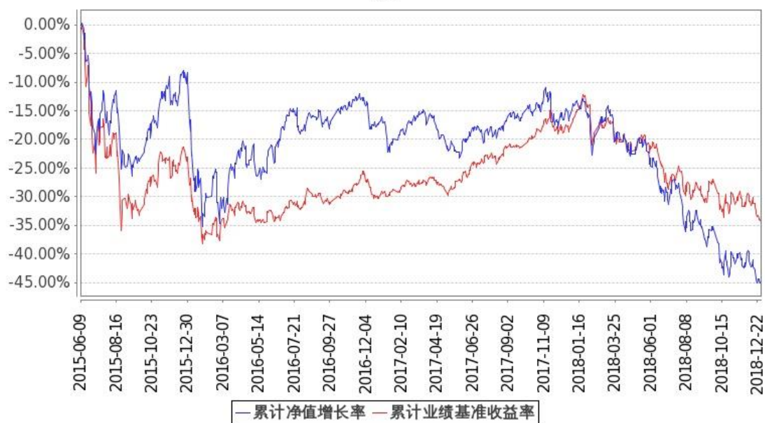
图：嘉实事件驱动股票基金份额累计净值增长率与同期业绩比较基准收益率的历史走势对比图