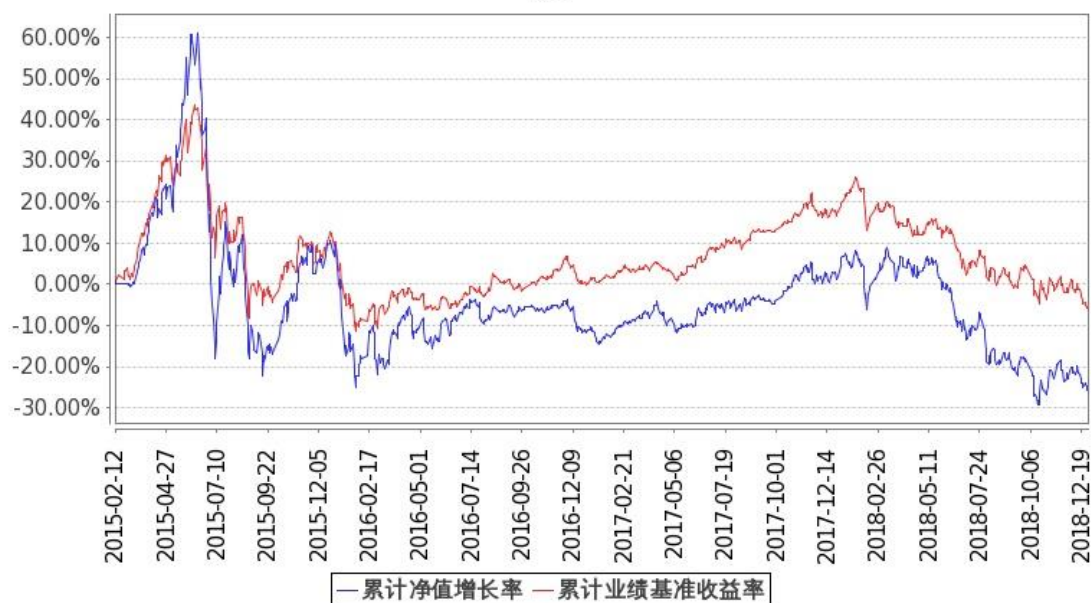
图：嘉实企业变革股票基金份额累计净值增长率与同期业绩比较基准收益率的历史走势对比图 (2015年2月12日至2018年12月31日)

注：按基金合同和招募说明书的约定，本基金自基金合同生效日起6个月内为建仓期，建仓期结束时本基金的各项投资比例符合基金合同（十二（二）投资范围和（四）投资限制）的有关约定。