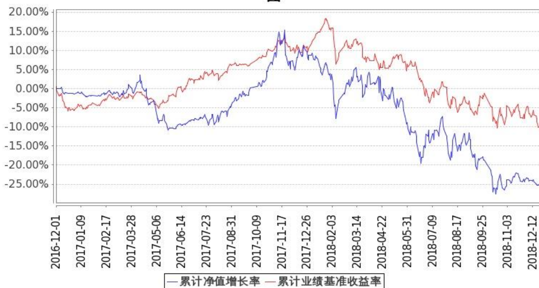
图：嘉实优势成长混合基金份额累计净值增长率与同期业绩比较基准收益率的历史走势对比图 (2016 年 12 月 1 日至 2018 年 12 月 31 日)

注：按基金合同和招募说明书的约定，本基金自基金合同生效日起 6 个月内为建仓期，建仓期结束时本基金的各项投资比例符合基金合同（十二（二）投资范围和（四）投资限制）的有关约定。