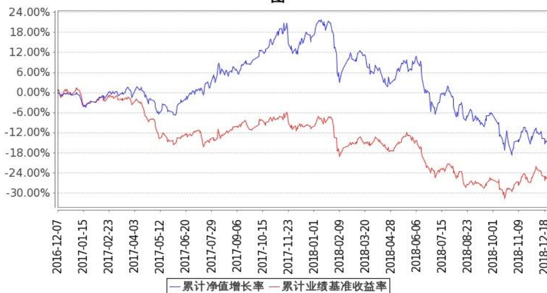
图：嘉实农业产业股票基金份额累计净值增长率与同期业绩比较基准收益率的历史走势对比图 (2016年12月7日至2018年12月31日)

注：按基金合同和招募说明书的约定，本基金自基金合同生效日起6个月内为建仓期，建仓期结束时本基金的各项投资比例符合基金合同（十二（二）投资范围和（四）投资限制）的有关约定。