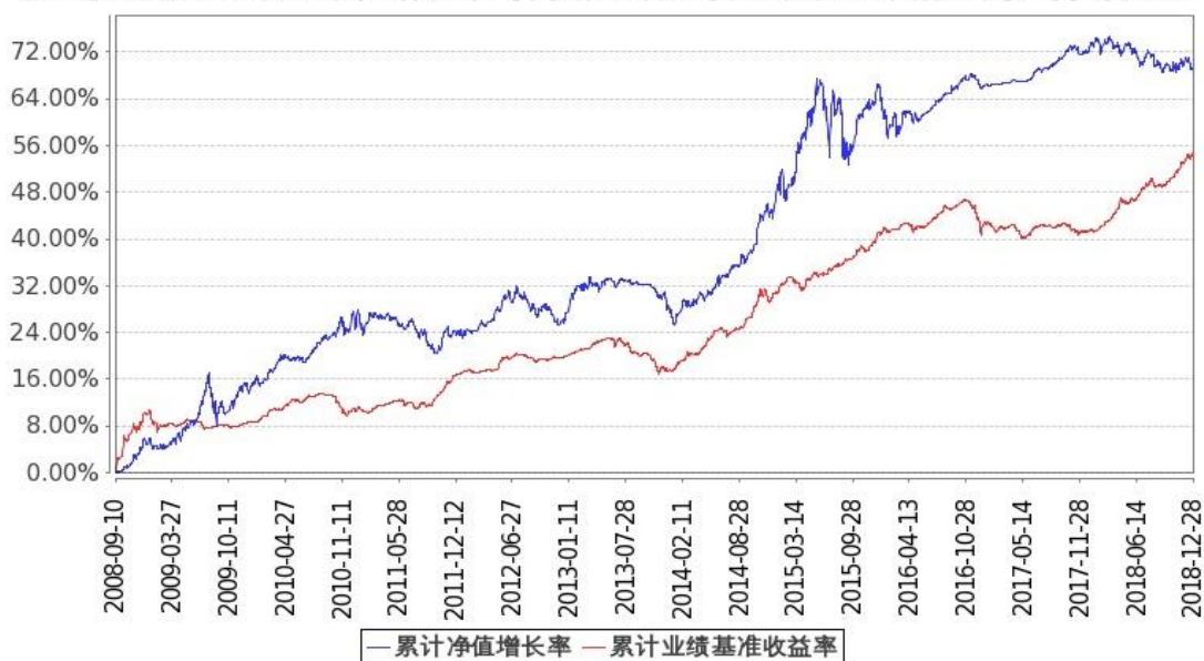
图 2: 嘉实多元债券 B 基金份额累计净值增长率与同期业绩比较基准收益率的历史走势对比图 (2008 年 9 月 10 日至 2018 年 12 月 31 日)

注: 根据本基金基金合同和招募说明书的约定, 本基金自基金合同生效日起 6 个月内为建仓期。建