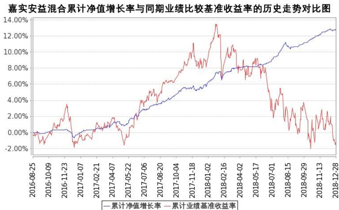
图：嘉实安益混合份额累计净值增长率与同期业绩比较基准收益率的历史走势对比图