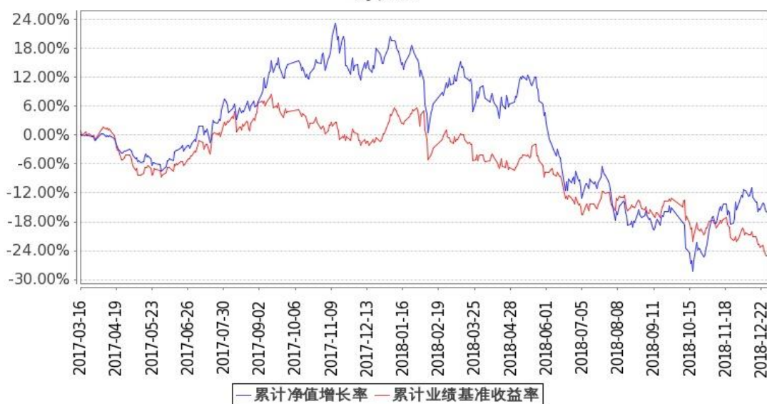
图 1：嘉实新能源新材料股票 A 基金累计份额净值增长率与同期业绩比较基准收益率的历史走势对比图