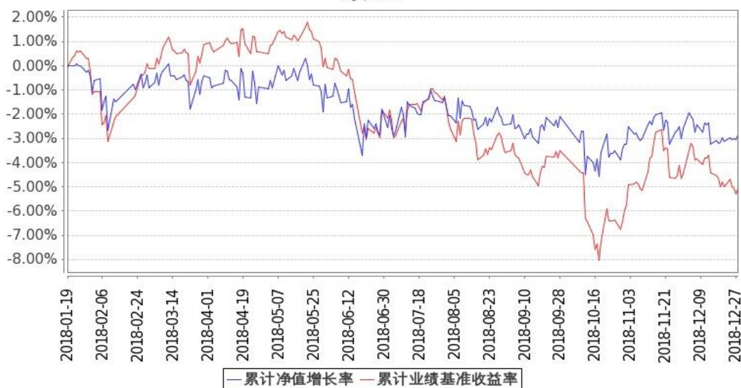
图：嘉实润泽量化定期混合份额累计净值增长率与同期业绩比较基准收益率的历史走势对比图 (2018 年 1 月 19 日至 2018 年 12 月 31 日)

注 1：本基金基金合同生效日 2018 年 1 月 19 日至报告期末未满 1 年。按基金合同和招募说明书的约定，本基金自基金合同生效日起 6 个月内为建仓期，本报告期处于建仓期内。