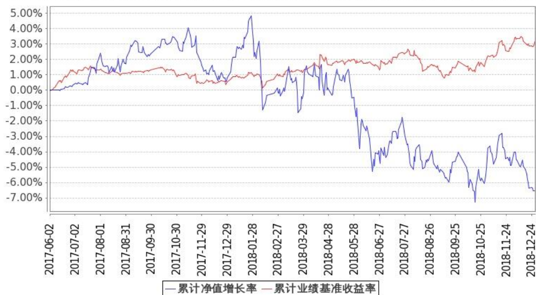
图 1：嘉实稳宏债券 A 基金份额累计净值增长率与同期业绩比较基准收益率的历史走势对比图