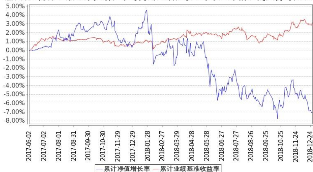
图 2：嘉实稳宏债券 C 基金份额累计净值增长率与同期业绩比较基准收益率的历史走势对比图