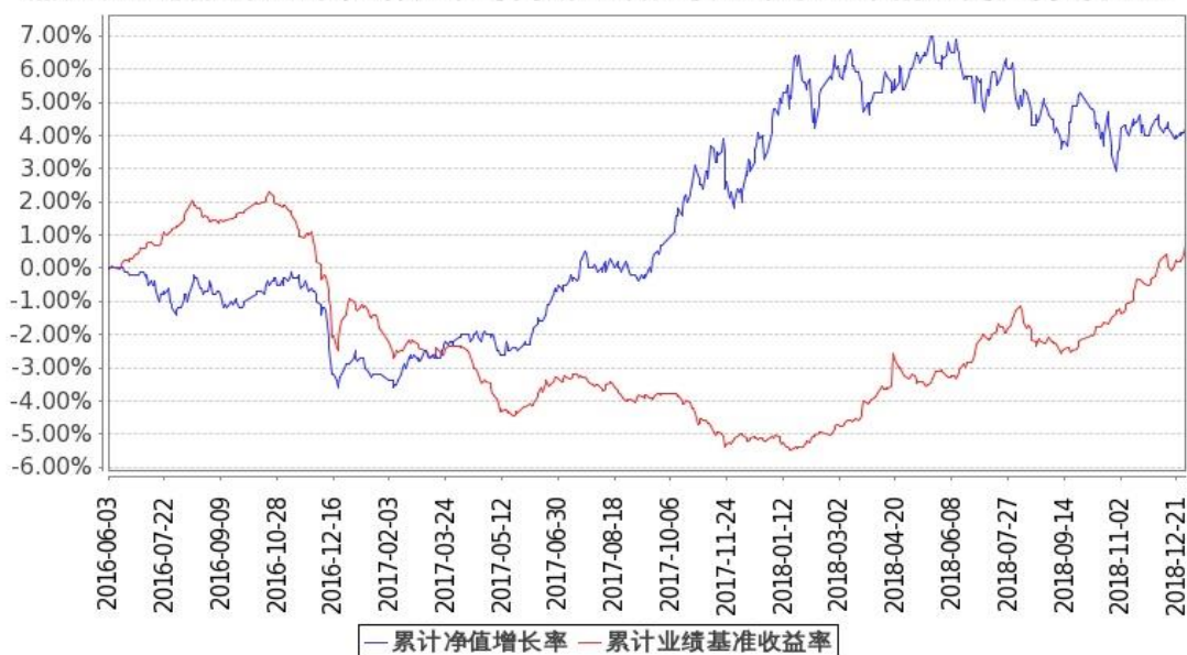
图：嘉实稳盛债券基金份额累计净值增长率与同期业绩比较基准收益率的历史走势对比图