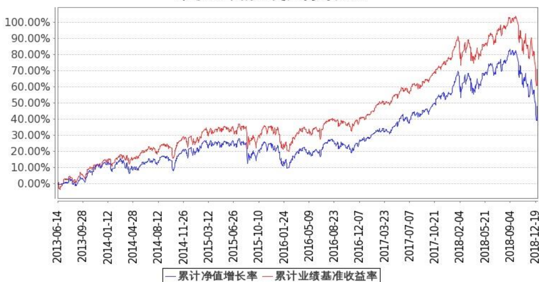
图 2：嘉实美国成长股票型证券投资基金-美元现汇基金份额累计净值增长率与同期业绩比较基准