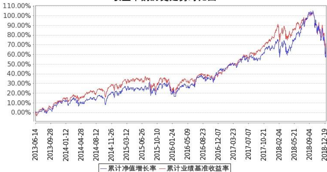
图 1：嘉实美国成长股票型证券投资基金-人民币基金份额累计净值增长率与同期业绩比较基准收益率的历史走势对比图