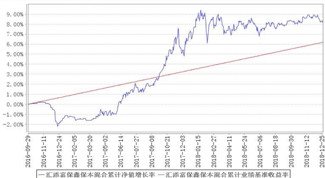
汇添富保鑫保本混合累计净值增长率与同期业绩比较基准收益率的历史走势对比图

注:本基金建仓期为本《基金合同》生效之日(2016年9月29日)起6个月,建仓期结束时各项资产配置比例符合合同规定。