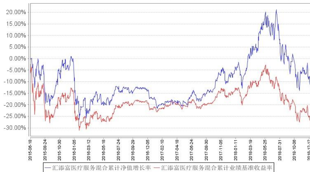
汇添富医疗服务混合累计净值增长率与同期业绩比较基准收益率的历史走势对比图

注:本基金建仓期为本《基金合同》生效之日(2015年6月18日)起6个月,建仓期结束时各项资产配置比例符合合同规定。