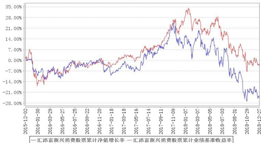
汇添富新兴消费股票累计净值增长率与同期业绩比较基准收益率的历史走势对比图

注:本基金建仓期为本《基金合同》生效之日(2015年12月02日)起6个月,建仓期结束时各项资产配置比例符合合同规定。