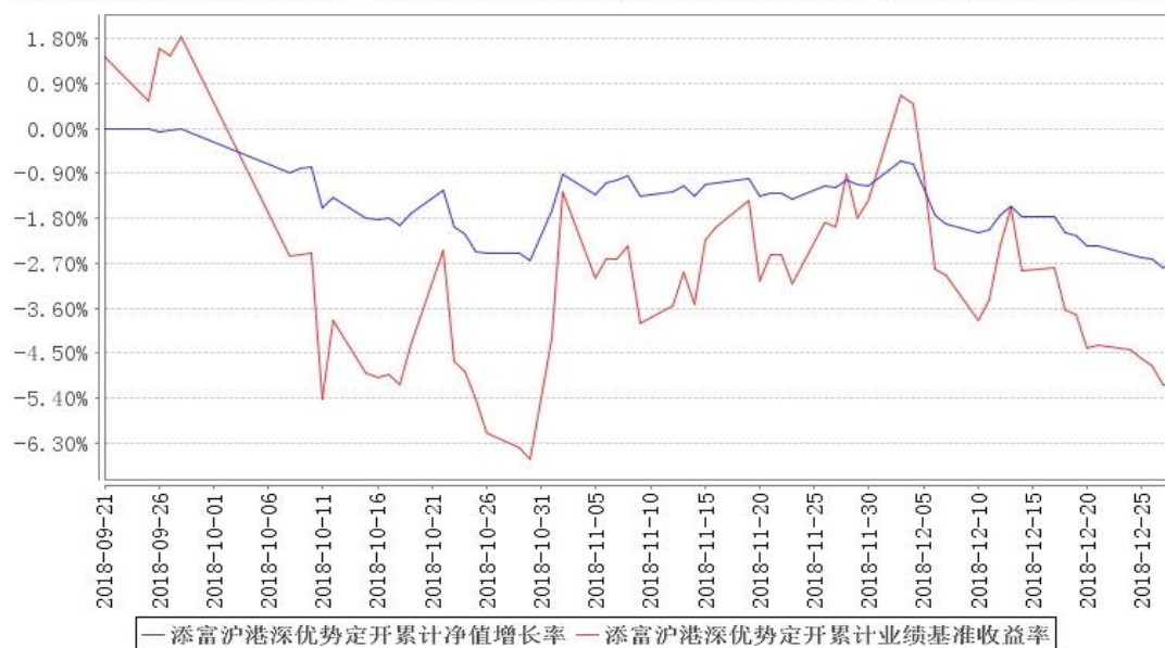
添富沪港深优势定开累计净值增长率与同期业绩比较基准收益率的历史走势对比图

注:本《基金合同》生效之日为 2018 年 9 月 21 日,截至本报告期末,基金成立未满一年;本基金建仓期为本《基金合同》生效之日(2018 年 9 月 21 日)起 6 个月,截止本报告期末,本基金尚处于建仓期中。