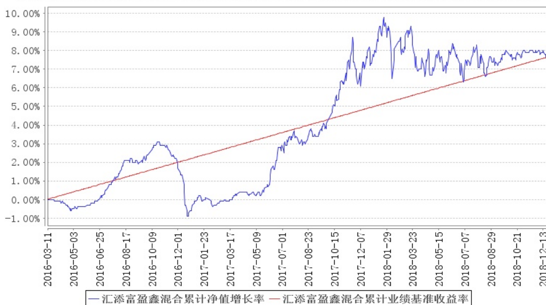
汇添富盈鑫混合累计净值增长率与同期业绩比较基准收益率的历史走势对比图

注:本基金建仓期为本《基金合同》生效之日(2016年3月11日)起6个月,建仓期结束时各项资产配置比例符合合同规定。