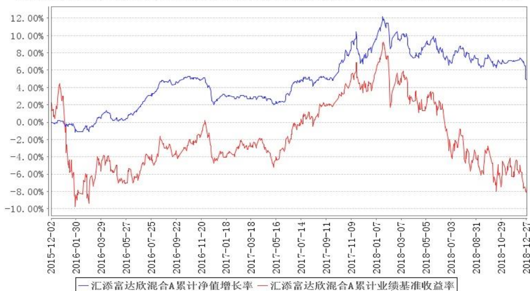
汇添富达欣混合A累计净值增长率与同期业绩比较基准收益率的历史走势对比图