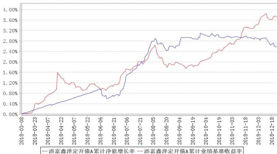
添富鑫泽定开债A累计净值增长率与同期业绩比较基准收益率的历史走势对比图

注:1、本《基金合同》生效之日为 2018 年 3 月 8 日,截至本报告期末,基金成立未满一年;本基金建仓期为本《基金合同》生效之日(2018 年 3 月 8 日)起 6 个月,建仓期结束时各项资产配置比例符合合同规定。