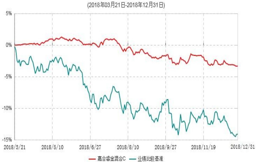
嘉合睿金混合C累计净值增长率与业绩比较基准收益率历史走势对比图