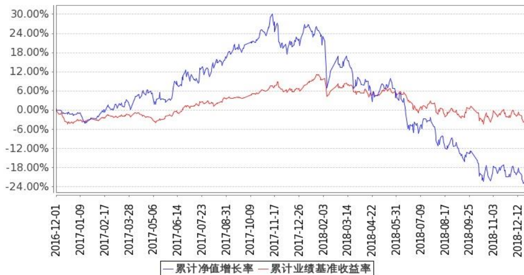
图：嘉实研究增强混合基金份额累计净值增长率与同期业绩比较基准收益率的历史走势对比图 (2016年12月1日至2018年12月31日)

注：1：按基金合同和招募说明书的约定，本基金自基金合同生效日起6个月内为建仓期，建仓期结束时本基金的各项投资比例符合基金合同（十二（二）投资范围和（四）投资限制）的有关约定。