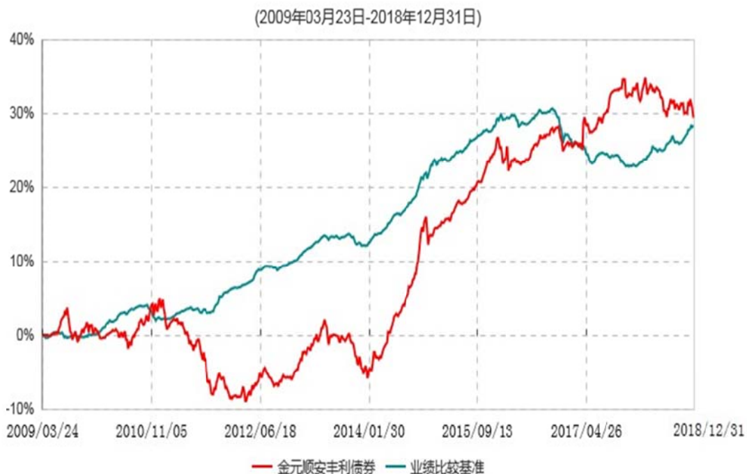
金元顺安丰利债券型证券投资基金累计净值增长率与业绩比较基准收益率历史走势对比图