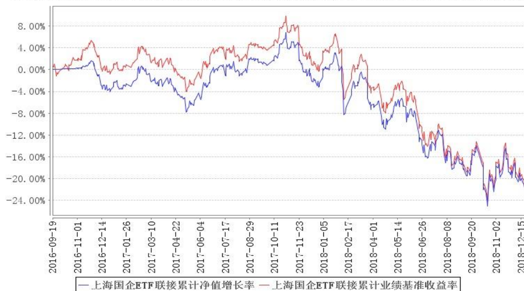
上海国企ETF联接累计净值增长率与同期业绩比较基准收益率的历史走势对比图

注：本基金建仓期为本《基金合同》生效之日（2016年9月18日）起6个月，建仓期结束时各项资产配置比例符合合同规定。